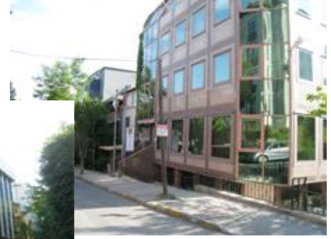
Esentepe Gazeteciler sitesi- Levent'in kaderi de bu mu?

Yine Levent'teki gibi işyerlerinin teklif ettiği yüksek rakamlar cazip gelmeye başlayınca evini işyerine kiralayan/satan arttı. İkamet etmek isteyenler azınlığa düştü. Şimdilerde artık işyerleri de burayı tercih etmiyor.